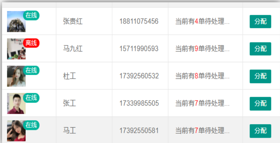
【PC端技术维修员派单列表】